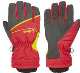
MARIS Evo Red