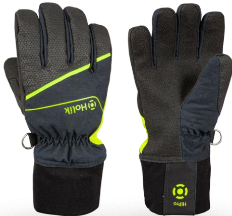
MARIS Flexi Navy Blue

Das Top-Modell aus unserem Portfolio. Sehr geringes Gewicht und optimale Passform durch innovative Nahtführung. Vier verschiedene Stulpenformen bieten die Möglichkeit einer perfekten Abstimmung mit dem Ärmel der Einsatzjacke.