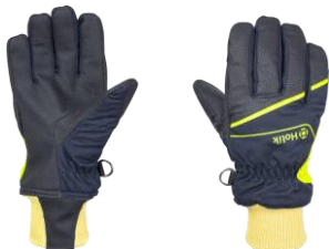
MARIS Short Navy Blue