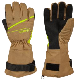
MARIS Long Beige