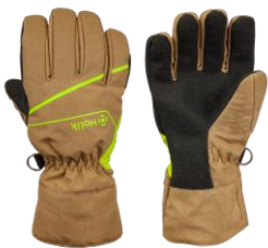
MARIS Easy Beige